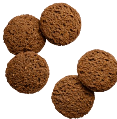
BASE Cookies ココア