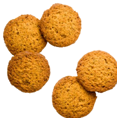
BASE Cookies アールグレイ