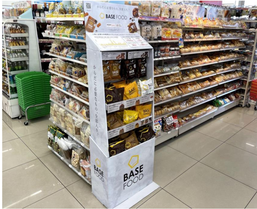
BASE FOOD 特設コーナー展開イメージ

* 商品詳細は公式ウェブサイトをご覧ください。 ( https://basefood.co.jp )