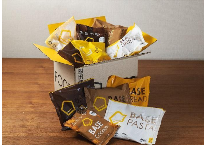
< BASE FOOD 定期購買イメージ >

「主食をイノベーションし、健康をあたりまえに」をミッションに、2017年に完全栄養食のパイオニアとして誕生し、完全栄養パスタ「BASE PASTA」をサブスクリプションサービスで販売開始。現在は、完全栄養パン「BASE BREAD」、完全栄養クッキー「BASE Cookies」とラインナップを増やし、2021年11月末にはシリーズ累計販売食数1,500万食を突破、2022年2月の月間定期購入者数は10万人を突破しました。