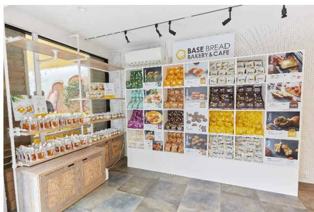
▲商品販売スペース