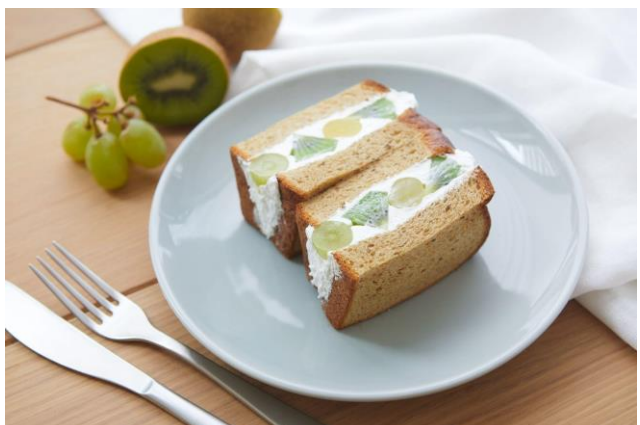
▲キウイとマスカットのフルーツサンド