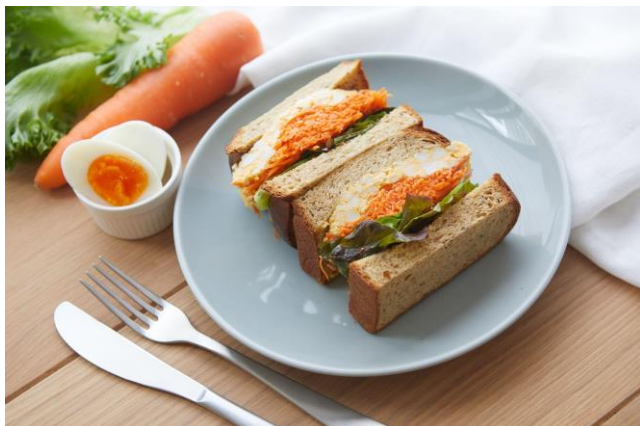
▲キャロットラペのサンドウィッチ