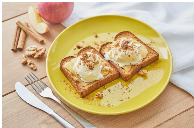
▲アップルシナモンのトースト