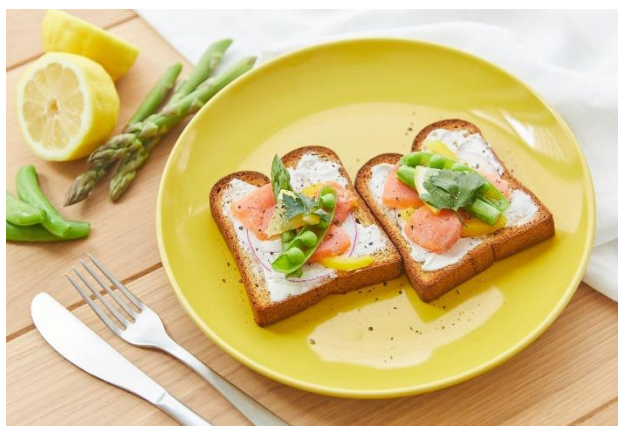
▲サーモンのオープンサンド