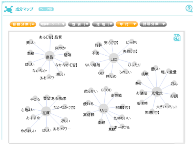
(※画像2) 属性分類モード(年代別) ※分析対象キーワード「コーヒー」