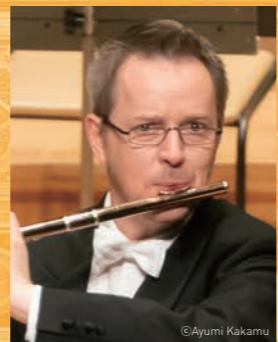
エルヴィン・クランバウアー (フルート)