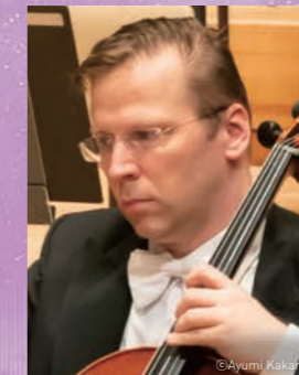
ペーテル・ソモダリ (チェロ)