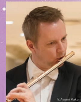
エルヴィン・クランバウアー (フルート)