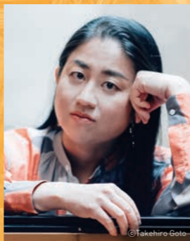
小菅 優 (ピアノ)

プログラム A1 豊田：3月31日(日) 14:00開演(13:15開場)豊田市コンサートホール 福岡：4月 4日(木) 19:00開演(18:15開場)アクロス福岡 福岡シンフォニーホール 東京：4月 7日(日) 16:30開演(15:45開場)サントリーホール 大ホール