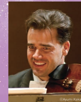
エルマー・ランダラー (ヴァイオリン)