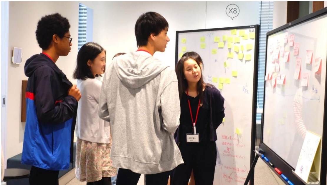
ビジネスプランを作り上げている高校生グループ。 ビジネスに始めて触れるとは思えないような、質の高い議論が繰り広げられている。