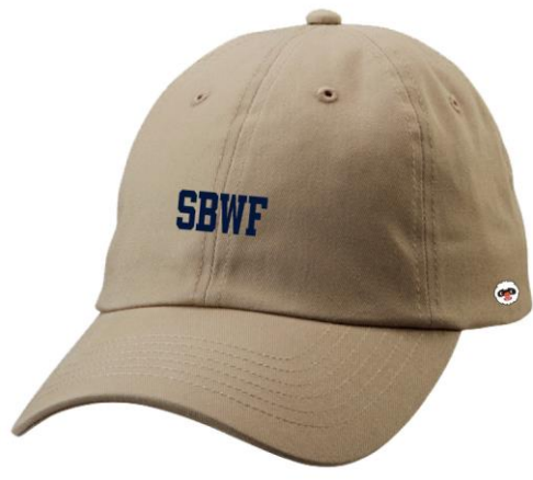
商品名：SBWF TWILL LOW CAP 価格：4,400円 カラー：ベージュ / ネイビー サイズ：ONE SIZE