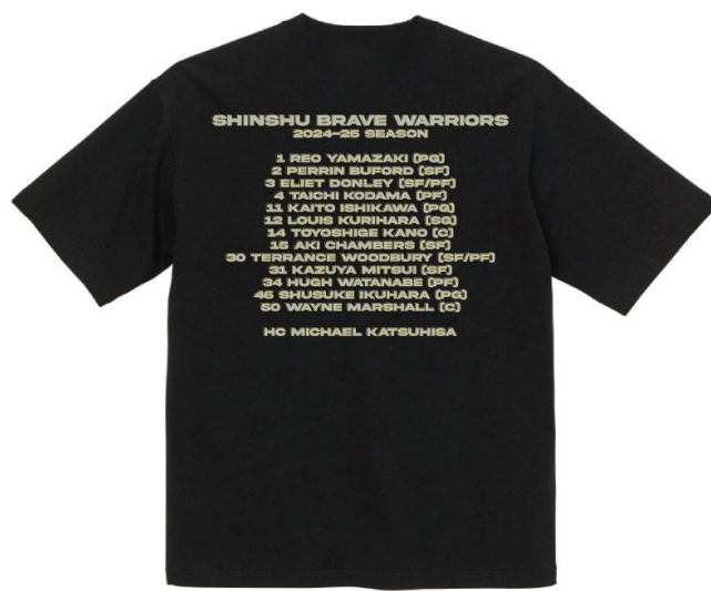
商品名：SBWF TEAM PRINT T-SHIRT 価格：6,600円 カラー：ブラック サイズ：M/L/XL