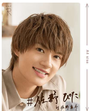
A4サイズ特大ステッカー イメージ