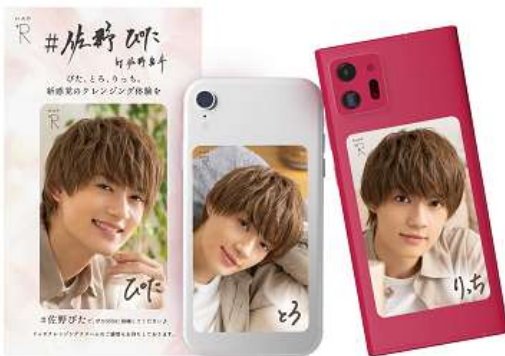
スマホサイズステッカー イメージ