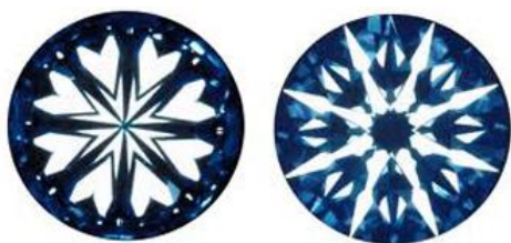
「ハート&キューピッド」