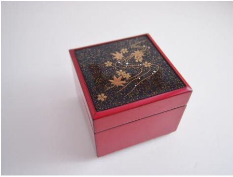
「ハート&キューピッド」金沢の漆金蒔絵にグランバーガーメレダイヤを散りばめたベルギー王室献上品の宝石箱