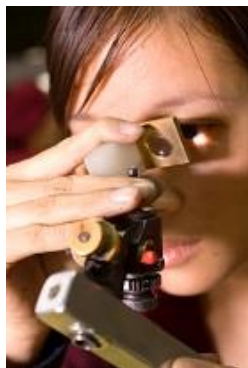
熟練工による高度なカット・研磨技術