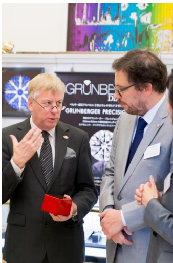
(左より) 献上品の宝石箱を持つギュンテル・スレーワーゲン駐日ベルギー王国大使、「グランバーガーダイヤモンドズジャパン株式会社」サイモン・グランバーガー社長 (於ベルギー王国大使館)