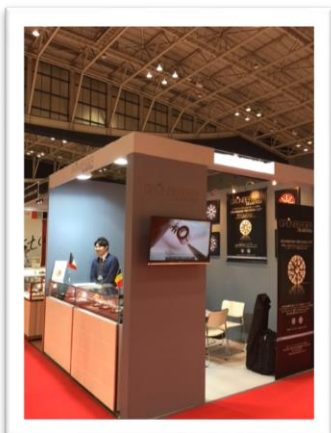
国際宝飾展 [IJT] 会場内 グランバーガーダイヤモンドズジャパン株式会社ブース

会場内展示場所：グランバーガーダイヤモンドズジャパン株式会社 ダイヤモンドワールドゾーン ブース A10-35