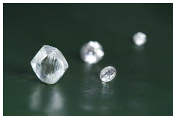
手前（左）カット・研磨前の天然ダイヤモンドと（右）グランバーガープレジジョンカット®完成品メレダイヤモンド

グランバーガーダイヤモンド社は、最も輝きの美しい理想的なカットティングと呼ばれるエクセレントカットをも超える独自の高精度なカットティング技術「グランバーガープレジジョンカット®」を開発。