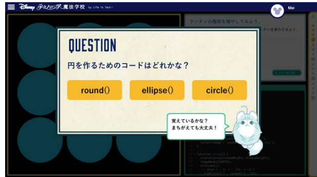
クイズ形式で理解度を確認