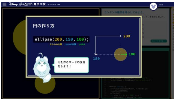
レクチャー部分はわかりやすく図解