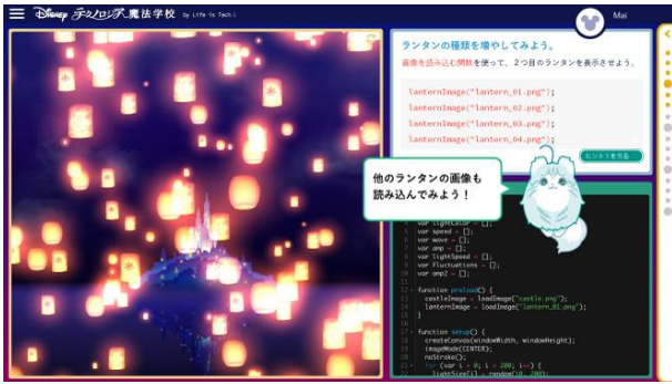
キャラクターが会話形式で学習すべきことをナビゲート