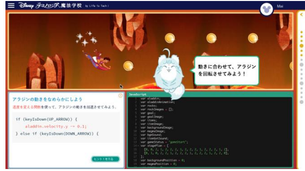
適切な学習情報量や柔軟なレイアウトで 初心者でもストレスなく学習可能