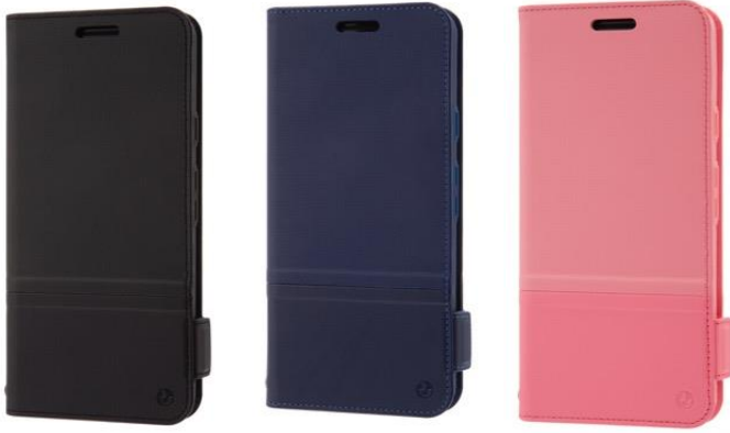
RILEGA Stand Flip