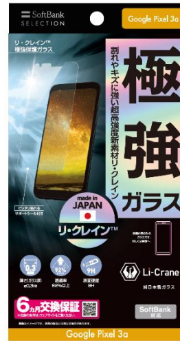
リ・クレイン™ 極強保護ガラス

「リ・クレイン™」とは スマートフォンのディスプレイ保護に特化して開発された、最高レベルの強度を誇る純日本製高品質ガラスです。一般的なアルミノシリケートガラスと異なり、リチウムを含み、ガラスの原子結合を強固にすることでより傷がつきにくく、極めて高い耐衝撃性を実現しました。