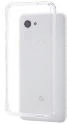
ガラスハイブリッド