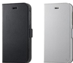
RILEGA Leather Flip