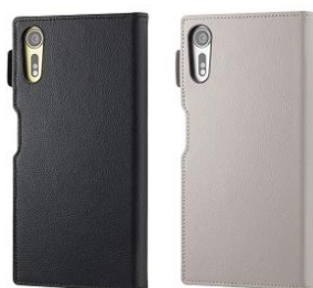
RILEGA Leather Flip