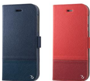
RILEGA Bicolor Stand Flip