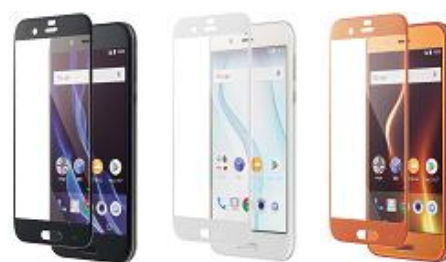
フレームカバー液晶保護ガラス