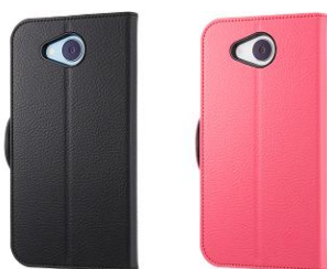
RILEGA Stand Flip