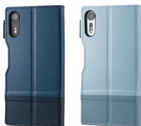
RILEGA Bicolor Stand Flip