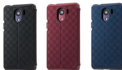
RILEGA Stand Flip