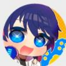
すばいすちゃんねる