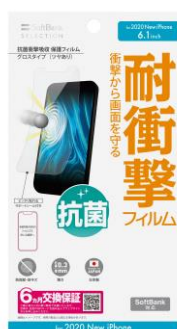
抗菌衝撃吸収 保護フィルム