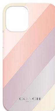
COACH ソフトバンク限定モデル

保護ガラス・フィルムも、ディスプレイ保護に特化して開発された超高強度新素材を採用した「リ・クレイン™ 極強保護ガラス」や、「PanzerGlass™ (パンザグラス)」からは、抗菌加工にプラスして優れた耐衝撃設計の保護ガラス「PanzerGlass™ 衝撃吸収 Edge-to-Edge, Black」、覗き見防止機能も備えた「PanzerGlass™ Privacy (覗き見防止) Edge-to-Edge, Black」などを多数ラインアップ。