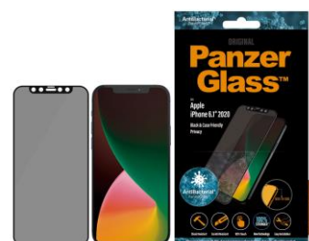
PanzerGlass™ Privacy(覗き見防止) Edge-to-Edge, Black