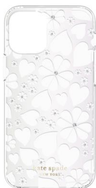
kate spade new york ソフトバンク限定モデル