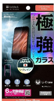
リ・クレイン™ 極強保護ガラス

保護ガラス・フィルムも、ディスプレイ保護に特化して開発された超高強度新素材を採用した「リ・クレイン™ 極強保護ガラス」や、「PanzerGlass™ (パンザグラス)」からは、抗菌加工にプラスして優れた耐衝撃設計の保護ガラス「PanzerGlass™ 衝撃吸収 Edge-to-Edge, Black」、覗き見防止機能も備えた「PanzerGlass™ Privacy (覗き見防止) Edge-to-Edge, Black」などを多数ラインアップ。