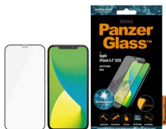
PanzerGlass™ 衝撃吸収 Edge-to-Edge, Black