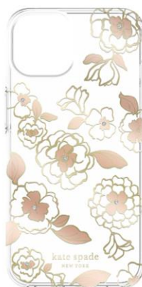
kate spade new york ソフトバンク限定モデル