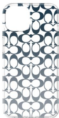
COACH ソフトバンク限定モデル

「COACH」「kate spade new york」からは、SoftBank SELECTION オンラインショップとソフトバンクショップ（一部店舗を除く）でのみ購入可能なソフトバンク限定モデルを発売します。