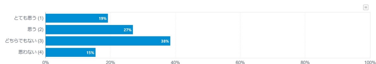
(図 3: アンケート結果の一部)

上記のような回答の他、アンケートの最後にコンテンツに関する意見を自由に回答してもらい、ユーザーの生の声を聞くことで、効果測定・改善に効く具体的な回答を得ることが出来ました。