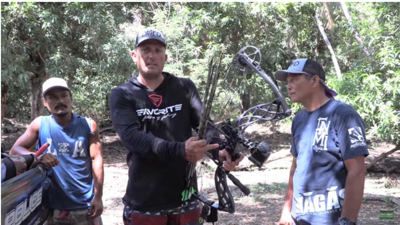
▲バガン島で野生の牛をハンティングする人気Youtuber ロバート・アーリントン（中央）

■サイパン・テニアン・ロタに関する情報は、マリアナ政府観光局の公式アカウントをご覧ください。