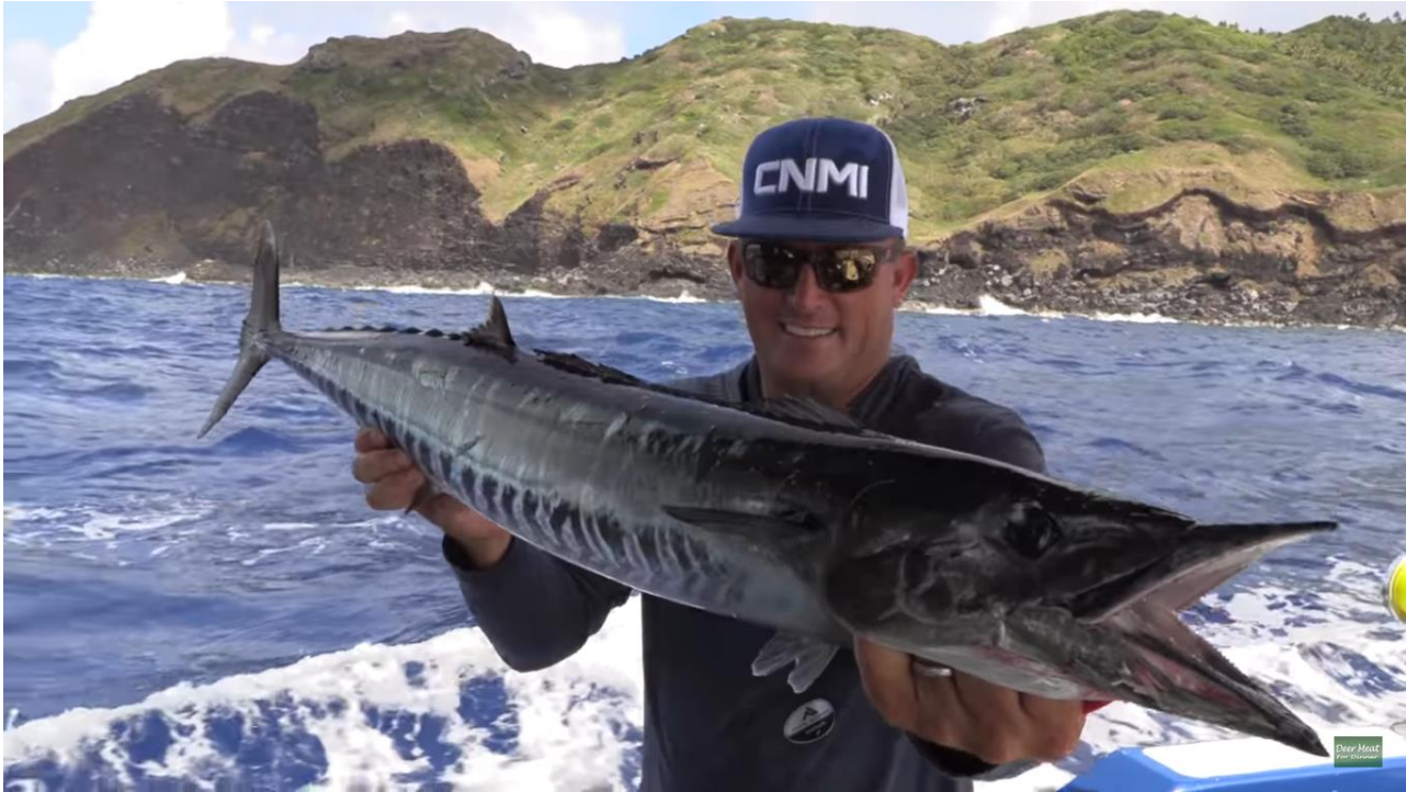
▲巨大なワフー（カマスサワラ）を釣り上げる。北マリアナ諸島周辺は、豊かな漁場に恵まれ、魚釣りも盛ん