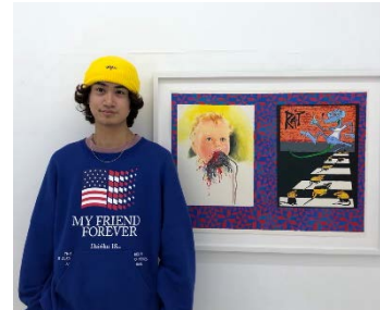
タイキ @777_777_777n ～ポップアートで街を楽しく！～

「#レジデントインスタグラマー-in Saipan、いよいよスタート」動画はこちら： https://youtu.be/yq64d7Bj1fU