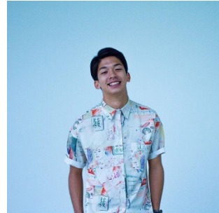
ジョージ @idakajoji ～得意の写真で伝えたい～