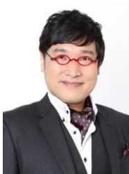
山里亮太 (南海キャンディーズ)