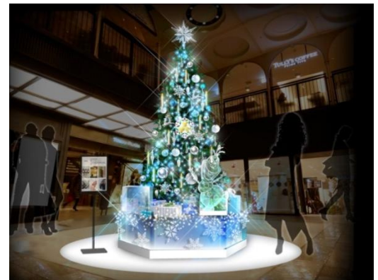
B2F エントランス / Ice Tree