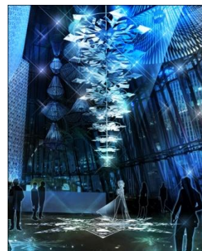
※ツリーや装飾の画像はイメージです。