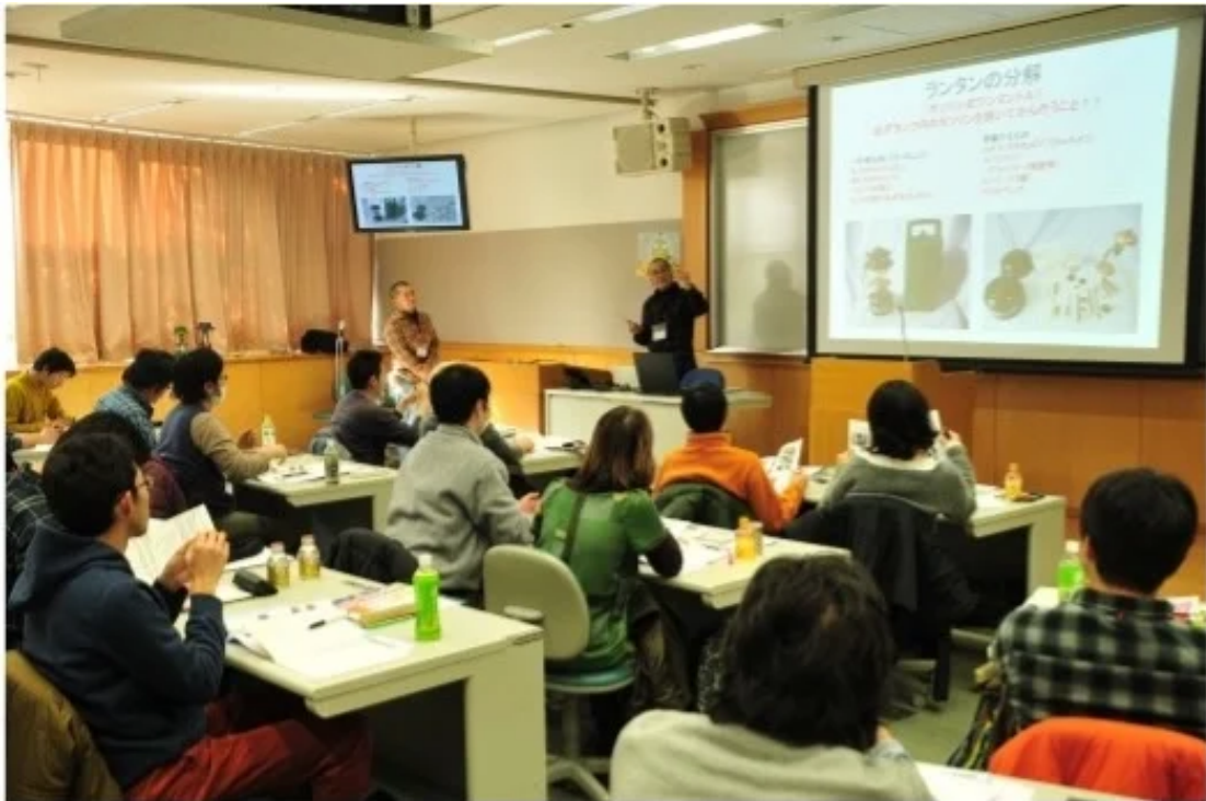
会場講習会の様子

1泊2日の講習会后、認定試験合格者には、日本オートキャンプ協会（JAC）より公認オートキャンプ指導者の合格証が交付されます。