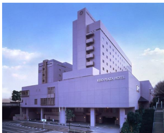
≪京王プラザホテル多摩≫