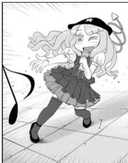
◀ 京王線の終電ちゃん ▶