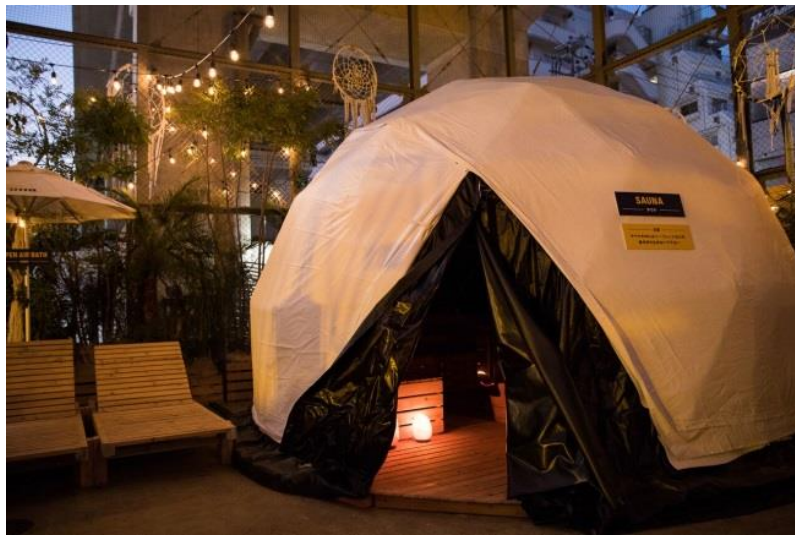
◀ CORONA WINTER SAUNA SHIMOKITAZAWA ▶