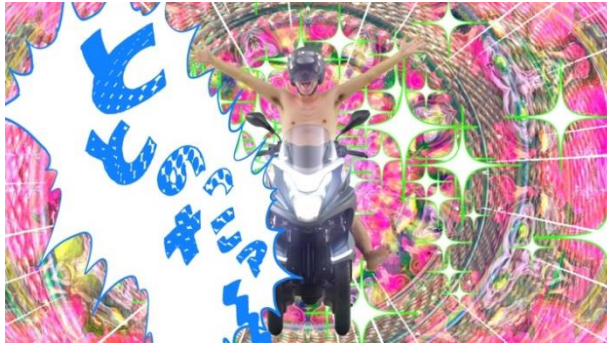
《WEBムービーイメージ》