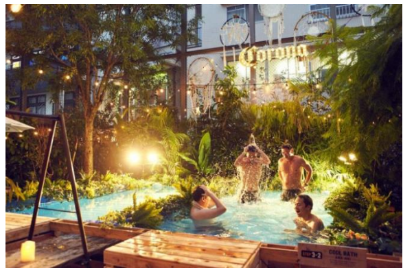
《サウナの様子 ㊟サウナ内 ㊞水風呂》