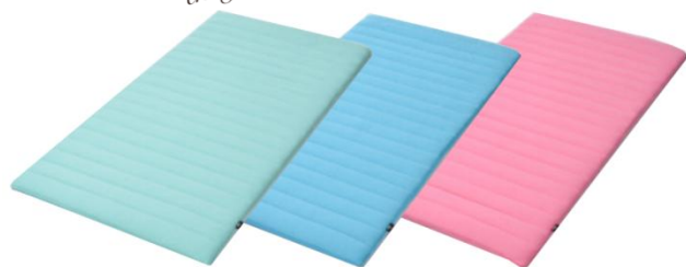
マットレスパッド