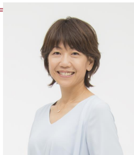
ライズ 製品開発アドバイザー 高橋尚子さん

中学から本格的に陸上競技を始め、県立岐阜商業高校、大阪学院大学を経て実業団へ。1998年名古屋国際女子マラソンで初優勝、以来マラソン6連勝。2000年シドニー五輪金メダルを獲得し、同年国民栄誉賞受賞。2001年ベルリンでは女性として初めて2時間20分を切る世界記録（当時）を樹立する。2008年10月現役引退を発表。公益財団法人日本陸上競技連盟 理事、公益財団法人日本オリンピック委員会 理事、公益財団法人東京オリンピック・パラリンピック競技大会組織委員会アスリート委員会委員長。その他「高橋尚子のスマイル アフリカ プロジェクト」や環境活動、スポーツキャスター、JICAオフィシャルサポーターなどで活躍中。