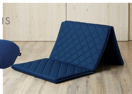
スリープオアシスアスリートモデル マットレス 厚さ5cm