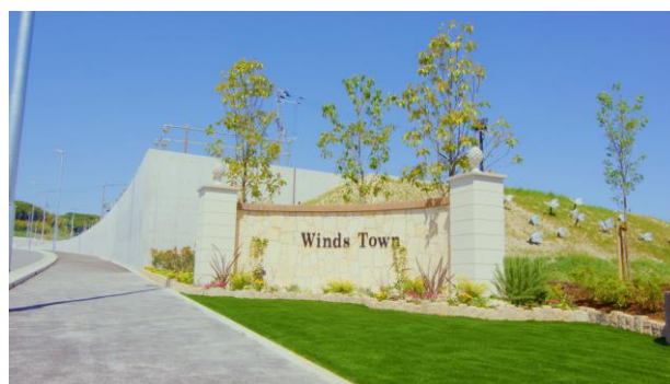
タウンゲート(サウス)

今後、各住戸の外構には、“アサギマダラ”が好むとされる“フジバカマ”の花を植えることを推奨するなど、自然豊かな環境の中、街ぐるみで生物多様性を実現する取り組みも予定しています。