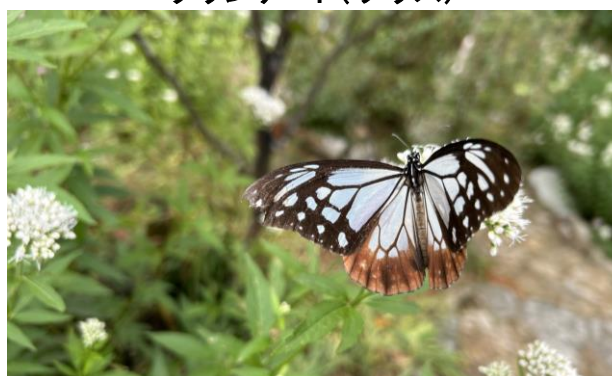
“フジバカマ”にとまる“アサギマダラ”