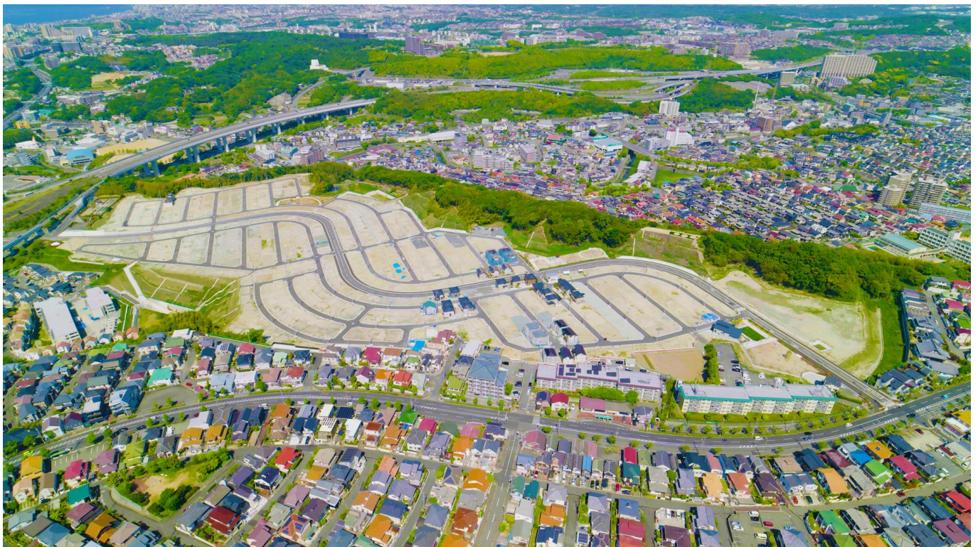
『ウインズタウン神戸みずき台』現地空撮

パナソニック ホームズ株式会社およびトヨタホーム株式会社、トヨタホーム近畿株式会社、ミサワホーム近畿株式会社、住友林業株式会社、セキスイハイム近畿株式会社が共同で販売企画を進めてきた兵庫県神戸市垂水区の大型分譲地『ウインズタウン神戸みずき台』(全589区画)は、このたび、2024年5月23日(木)にまちびらきし、全事業会社の第一期分譲がスタートします。