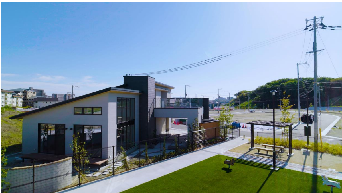
『ウインズタウン神戸みずき台』コミュニティコテージ外観