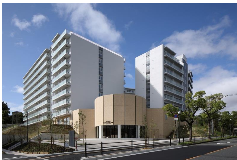
『大阪大学グローバルビレッジ津雲台』 国際学生寮・教職員宿舎 外観

同施設の事業は、上記 3 社が出資する特別目的会社(SPC)である、PFI 阪大グローバルビレッジ津雲台株式会社が担います。