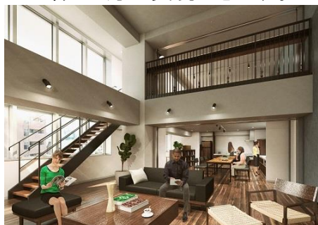
共用スペース イメージ

UDS 株式会社が運営するシェアハウス「ライツアパートメント」は、居室に水回り設備を備え、フロア毎に共用スペースを設置。充実した施設とともに、ゆとりある空間で交流ができる暮らしを提供します。また、ライブラリーやワークスペースなどの設備もあり、用途に合わせて自分らしい暮らし方が実現できます。