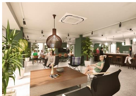
共用スペース イメージ