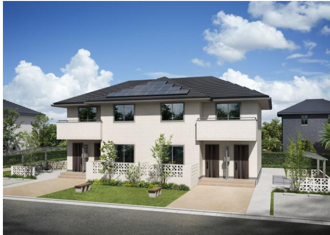
『YOUR MAISON NEXT』外観イメージ(重ね建てタイプ・4戸プラン)

パナソニックホームズ株式会社は、2026年7月1日、沖縄県で賃貸住宅商品『YOUR MAISON NEXT(ユアメゾン ネクスト)』の販売を開始します。同時に、同賃貸住宅を建てていただくファーストオーナーさまの募集も行います。