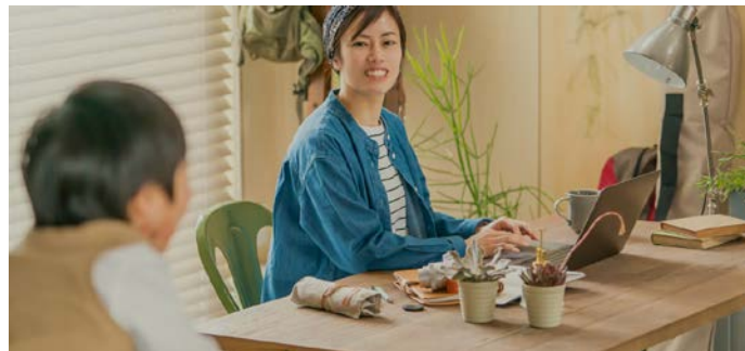
『おうち時間を楽しもう！』ワークスペース イメージ

パナソニック ホームズ株式会社では、当社のきれいな空気の家だからできる働き方・遊び方の新・生活様式『おうち時間を楽しもう！』を、6月17日から、戸建住宅の全商品で新しく展開します。