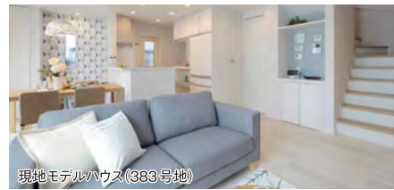
現地モデルハウス(383号地)