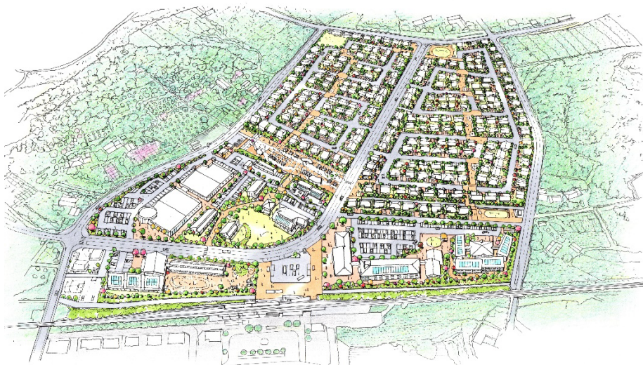
『Up DATE City ふくしま』イメージ図

『Up DATE City ふくしま』は、17 代当主・独眼竜政宗で知られる伊達氏が最初に居住したとされる高子岡館跡に隣接し、阿武隈急行「高子駅」北側隣に接地。「福島駅」から阿武隈急行で約 14 分、車で約 25 分の場所にあります。また、相馬福島道路「伊達中央 IC」から車で約 2 分、2024 年以降に開業が予定されている、東北屈指の売り場面積を誇る施設「(仮)イオンモール北福島」から約 4 kmの場所に位置しています。