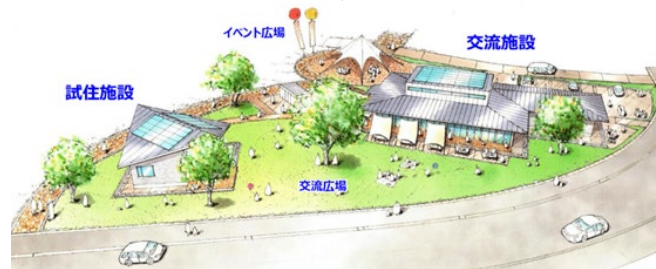
CCAC 施設「U-プレイス伊達」

※掲載している画像やイラストは全てイメージです。実際とは異なる場合がありますので、予めご了承ください。