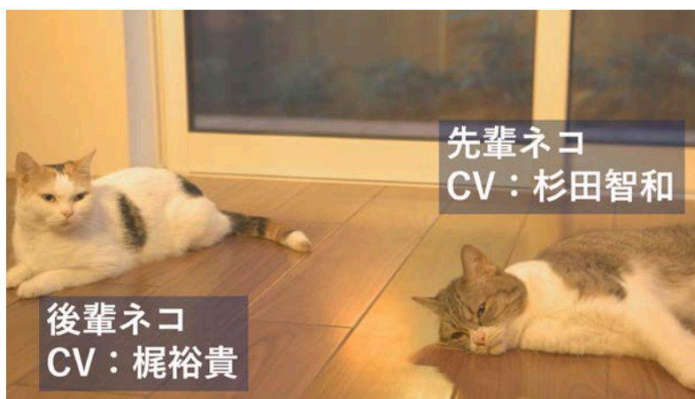
「地震への備え」篇 カット写真