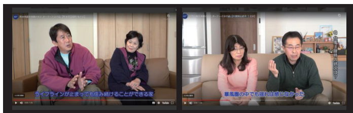
04 熊本地震、千葉台風で被災された オーナー様の声&リモートトーク