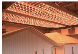
02 住宅試験 センター見学