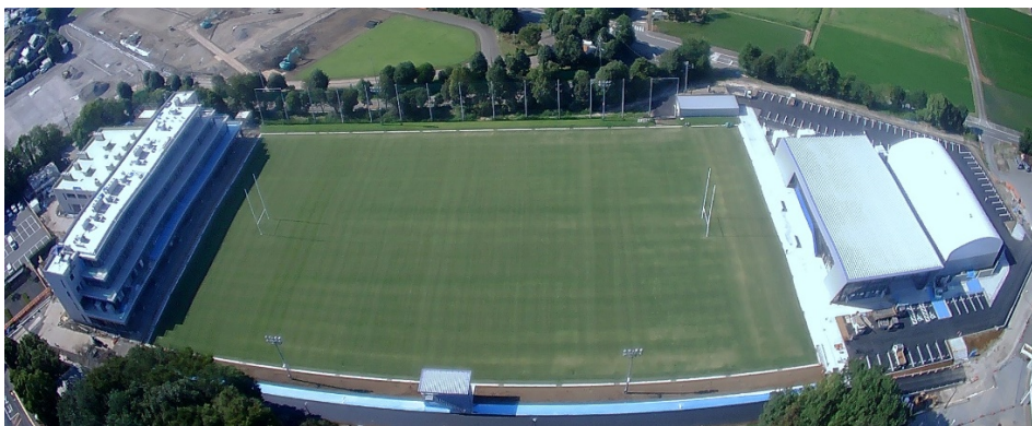
『さくらオーバルフォート』(左:宿泊棟、右:管理棟・屋内運動場)

国内屈指の競技施設である熊谷ラグビー場に加え、今回新設された『さくらオーバルフォート』(管理棟、屋内運動場、グラウンド、宿泊棟)において、それぞれの事業者が新たな価値の創出を念頭に意欲的な活動を展開することで生まれる、「スポーツをする、観る」「泊まる」「食べる」「買う」「集う」「学ぶ」「創造する」等々の魅力的な機能を生かして、このエリアを活気と賑わいにあふれ、世界に発信できるラグビーパークとなることを目指しています。