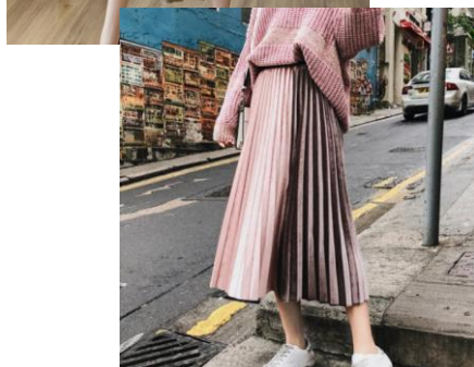
ベロアチュールスカート