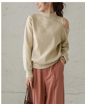
キーネックニット(左)