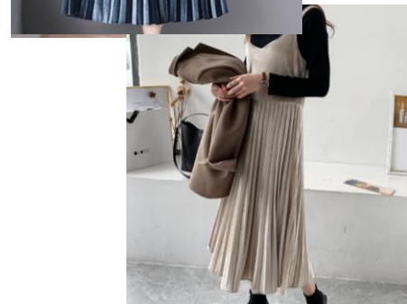
ベロアミモレ丈ワンピース