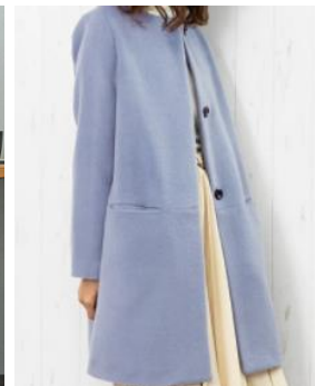
ボアロングカーディガン(左)