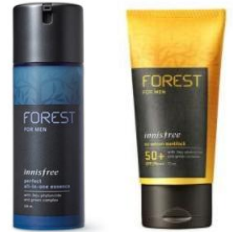
FOREST FOR MEN

5位、9位の「FOREST FOR MEN」は、「雪花秀(ソルファス)」、「IOPE(アイオペ)」、「エチュードハウス」等、日本人にも人気のブランドを展開する韓国大手化粧品会社「AMORE PACIFIC(アモーレパシフィック)」の主力ブランド「innisfree(イニスフリー)」の男性向けラインです。オールインワンエッセンスとUVケア商品がランクインしています。