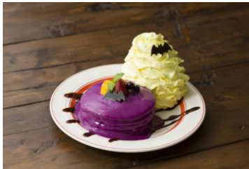
トリックブラッドパンケーキ 1,680円（税別）