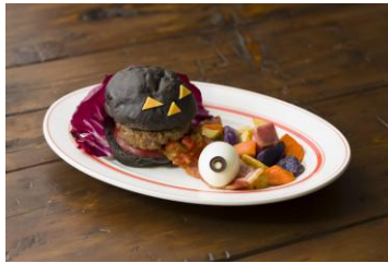
トリートモンスターバーガー 1,580円（税別）