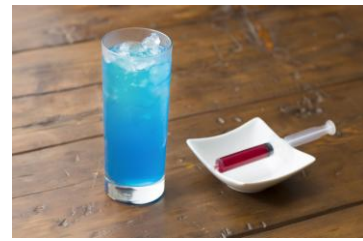
ハロウィンドリンク 650円（税別）