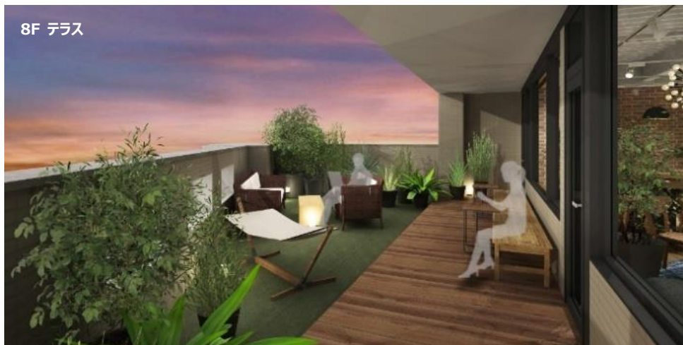
8F ラウンジ・テラス