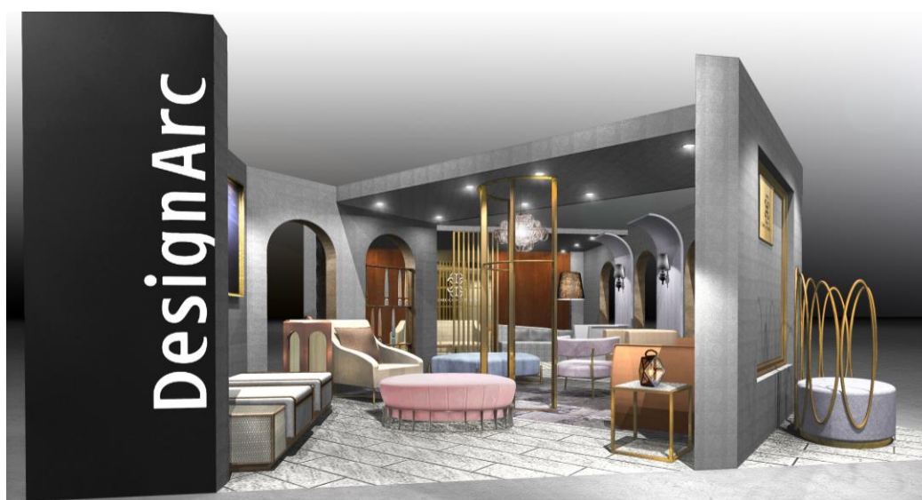
<ブース外観イメージ図>

ご多忙のところ誠に恐縮ではございますが、「CORE CONCEPTION」の世界観をブースにて、ぜひご体感いただきたくご案内申し上げます。