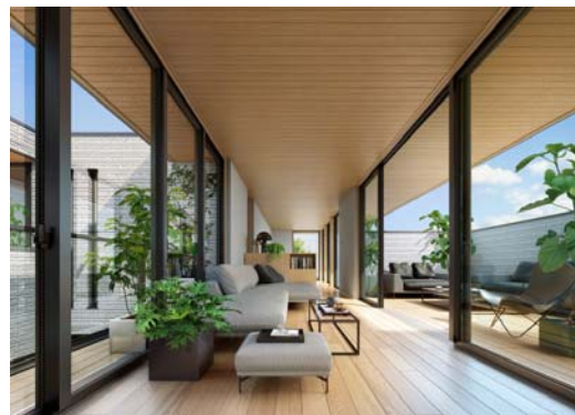
「2 階における 2m72 cm」の空間イメージ