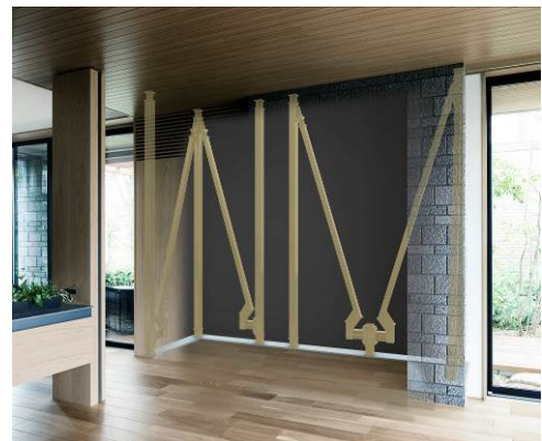
「持続型耐震 xevo \Sigma s」