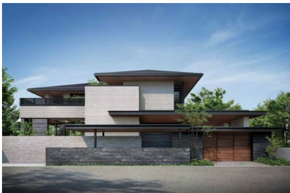
「xevo Σ PREMIUM」外観パース

大和ハウス工業株式会社(本社:大阪市、社長:芳井敬一)は、2018年10月1日より、富裕層をターゲットとした住宅業界最高クラスの鉄骨住宅商品「xevo Σ PREMIUM(ジーヴォシグマプレミアム)」を発売します。