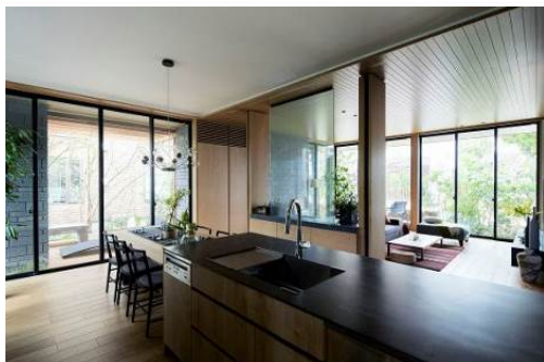
さらなる大開口でも ZEH 基準をクリア

※6. 2017年度のxevo \Sigma の断熱性能(ハイクラス断熱)でZEH基準をクリアするプランに対する検証結果。