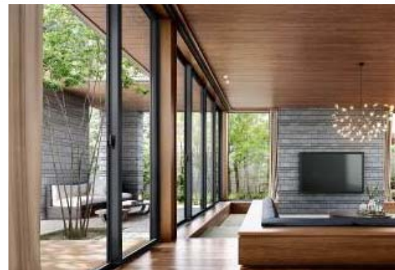
さらなる広がりを生み出す「グランフルデザイン」

このたび発売する「xevo Σ PREMIUM」は、「日々の暮らしに充足感を提供する都市の邸宅」をコンセプトに、業界最高水準*1の断熱・耐震性能、長期保証を実現した商品です。