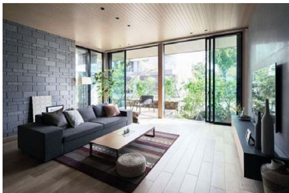
「グランフルデザイン」

あわせて、周囲の視線を気にせず大開口を設けられるよう、外からの視線を遮る腰壁高さ（約 185cm）のバルコニーやルーバーなどの外装材も拡充し、「2 階における 2m72cm」の提案を強化しました。