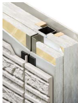
断熱仕様「エクストラ V」