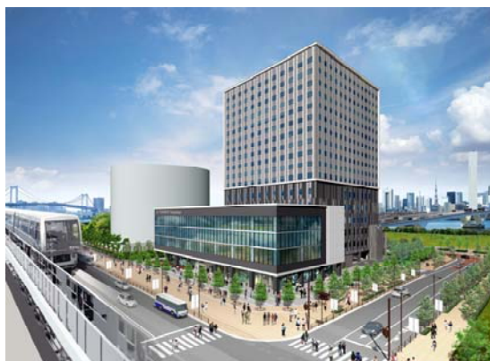
【(仮称) Dタワー豊洲」外観イメージ】

大和ハウス工業株式会社（本社：大阪市、社長：芳井敬一）は、現在、東京都江東区豊洲において、地上17階建ての複合施設「(仮称) Dタワー豊洲」を建設中ですが、その概要が決定しました。