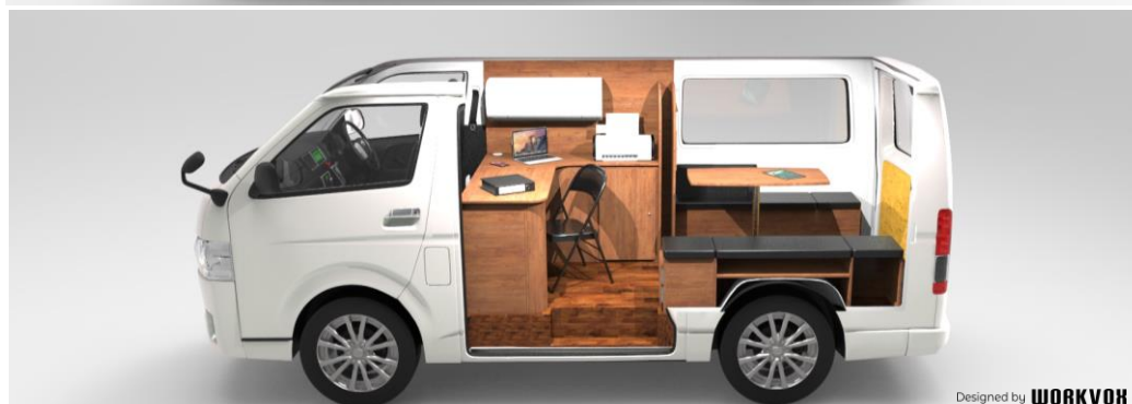
移動現場事務所 新型モデル <上：NV200 バネットバン、下：ハイエースバン> (イメージであり実際とは異なる場合があります)