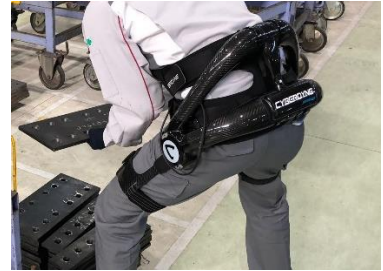
【ロボットスーツを利用した作業】