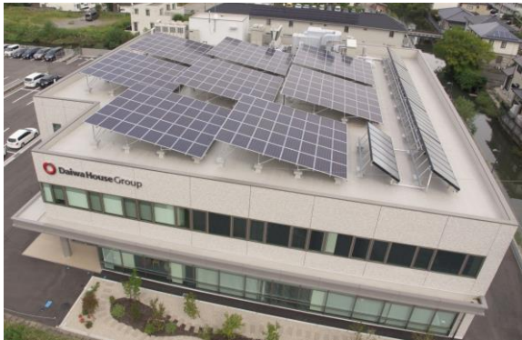
【大和ハウス佐賀ビル】

大和ハウスグループは、今後も地球温暖化防止という世界共通の社会課題に対して、省エネルギー・再生可能エネルギーの取り組みを積極的かつ計画的に実施し、脱炭素社会の実現と企業収益の両立を果たしていきます。