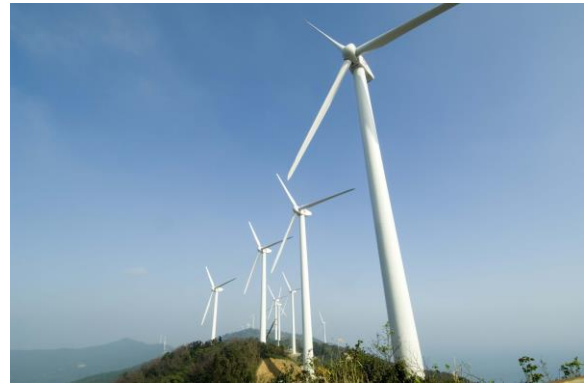
【佐多岬風力発電所】