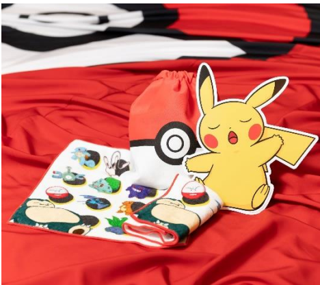
オリジナル巾着・カード