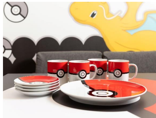
「ポケモンルーム」室内写真

東京・京都の「MIMARU」5施設※で、オリジナルデザイン「ポケモンルーム」をご用意しました。「ポケモンルーム」ご宿泊のお客さまは、モンスターボール柄オリジナルカトラリーも利用可能です。また、オリジナルノベルティグッズもプレゼントします。