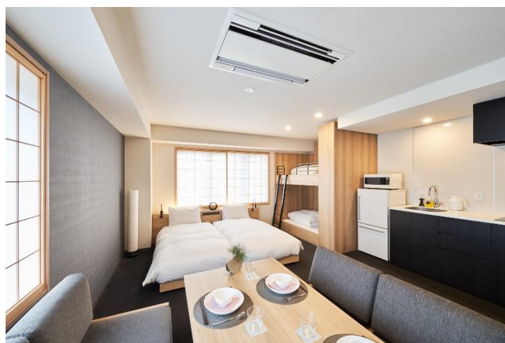
▲客室イメージ (4人で宿泊できるデラックスファミリー アパートメントタイプ)