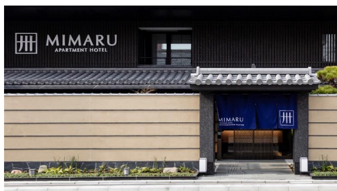
▲「MIMARU 京都 西洞院高辻」外観

※対応言語：英語、中国語、韓国語、ポルトガル語、スペイン語、ベトナム語、フィリピン語、タイ語、フランス語、ネパール語、ヒンディー語、ロシア語、インドネシア語