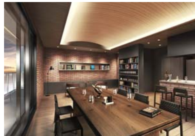
【エントランスホール（「ブライトゲート」）】 【スカイラウンジ（「アクアゲート」）】

※2. 住宅流通研究所調べによる。2000年以降札幌市中央区に供給した新築分譲マンションにおいて、総戸数が最大。(2019年1月現在)